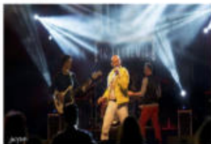
In Extremis (Queen Tribute Band) vainqueur de la 1 re édition «The Giants of Rock» du Invest tribute band festival.

Ce Festival accessible à des Tributes bands confirmés qui souhaitent concourir à investir pour leurs projets en devenant partenaire d'une équipe de professionnels sous la convention Rock'Occitanie s'est déroulée pendant 3 jours dans la salle polyvalente de la commune de Saint-Hilaire de Brethmas, (32). Après une sélection sur vidéo des nombreux postulants au regard sur leur qualité musicale, scénique et artistique, les organisateurs de B & S Events ont réuni 6 Tributes Bands de US-Tribute-Megadeth-Toto-Pink Floyd et Queen pour se produire en configuration live sur une scène de 100 m 2 dans 2 demi-finales les 13 et 14 avril 2018.