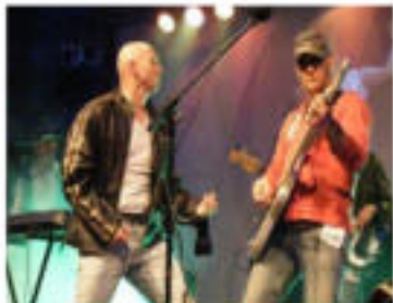
In Extremis fait tourner un projet musical en 2012.

In Extremis reprend le répertoire du flamboyant groupe britannique, dimanche soir à La Salamandre.